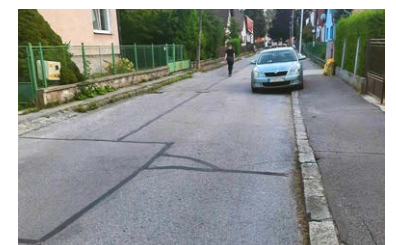
Večer je parkujúcich áut menej, no obrubníky nie sú zničené samy od seba.

Právo na normálny život Ide o verejný priestor – nepatrí len obyvateľom Starej Ľadovne. Krížia sa tu záujmy a práva a treba ich zladíť. No zatiaľ to vyzereá, že väčšie práva majú Ľadovňanci zo sídliska a cudzí, než obyvatelia Starej Ľadovne. Ľadoveň nemá parkovací dom, cintorín ani amfiteáter nemá parkovací dom – a „trieši“ sa to na úkor Starej Ľadovne... Ide o tisíce ľudí a áut, ktorí nemajú so Starou Ľadovňou nič spoločné – len tam parkujú a prechádzajú tadiaľ... No aj občania Starej Ľadovne majú svoje práva, rovnaké ako ľudia zo sídliska. Človek počúva – a nechce sa mu veriť. A nechce sa mu robiť arbitra – veď toto nie je spor. Toto nie je proti „sídlisťanom“ – to je len o normálnom porozumení a ohľaduplnosti. Ak to chýba – povolaným arbitrom je mesto.