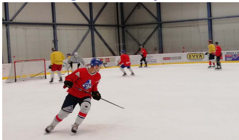
Martinskí hokejisti využívali cez leto aj tréningovú halu v Krásne n. Kys.

Ak sa podarí dokončiť tréningovú halu (rozmery klziska budú identické, ako má hlavná hracia plocha, bude prepojená spojovacím krčkom s veľkou halou, kde sú šatne i celé zázemie, a mala by byť prevádzkovaná 12 mesiacov v roku), bolo by to veľkým prínosom pre hokejovú mládež v Martine. Ale pomohla by to aj krasokorčuľovaniu a športovej verejnosti. Je to potrebné aj preto, že v prípade novej plochy bude relatívne