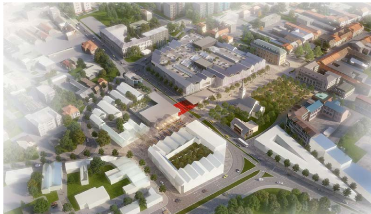
Toto riešenie námestia spolu býv. Riadkom, tržnicou, revitalizáciou podchodu i Smrtnej ul. a s parkovacím domom "padlo". Aké vyjde zo súťaže?