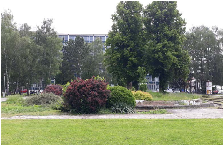
Smutne známa “dominanta” Vajanského námestia - “fontána” problémová od jej vzniku koncom 70. rokov 20. stor.

Z veľkých, miliónových, prišiel vo štvrtok 17. septembra na rad i dlhotrvajúci problém s dostavbou tréningovej hokejovej haly i problémom rekonštrukcie Vajanského námestia, no aj menšie, ako riešenie pohrebiska v Priekope, nadácia Nová šanca i rozvoj oddychového areálu SIM v Priekope.