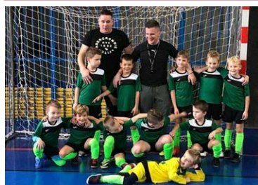
Futbalisti FC Attack Vrútky.

a Inter sme deklasovali 8:0. Naša výkonnosť je v domácej kolkárni na vysokej úrovni, ak by sa nám darilo aj vonku, mohol by to byť vydarený ročník. Škoda, že sa náš rozbeh teraz trochu zastaví pre aktuálnu situáciu s Covid-19 v Česku a po rozhodnutí českej vlády. Slovenské družstvá odohrajú na jeseň zápasy medzi sebou a na jar sa presunieme do Česka. Dúfam, že na výborný výkon, ako sme predviedli proti Interu, nadviažeme v nasledujúcich dueloch.“ Čo sa týka ženského tímu Lokomotíva Vrútky, ten v prvých zápasoch novej sezóny vykročil úspešne za obhajobou titulu v slovenskej extralige družstiev.