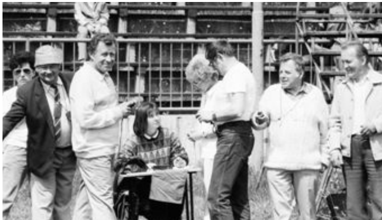
Rozhodcovský zbor v cieľi bežeckých disciplín.

Ešte nikdy v histórii Turčianskych hier nevisel Damoklov meč tak nízko nad ich ďalším osudom ako v roku 2002. Katastrofálne podmienky na martinskom futbalovom štadióne, kde kráľovnú športov poslali do exilu a z jej verných „poddaných“ urobili bezdomovcov, znamenali stop atletickým súťažiam v tomto objekte.