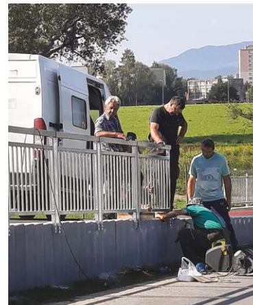
Posledné práce 15. septembra - výmena štrky za jemnejšiu a montáž zábradlia

Bol by som rád, keby občania chápali tento úsek ako súčasť takéhoto rozsiahlejšieho zámeru, a nie ako niečo vytrhnuté z kontextu. Budem sa tomu venovať ďalej a žiadať, aby sme to dorobili až po tomčiansky „kruháč“. Popri bývalom družstve sa nám podarilo urobiť s Pozemkovým fondom nájomnú zmluvu a tam môžeme urobiť aspoň chodník. Budem hľadať podporu, aby sme na meste získali financie na toto pokračovanie, to je pre mňa priorita. Vyriešiť potrebujeme aj začiatok cyklotrasy pod amfiteátrom a prepojiť ju na Ul. A. Sokolika smerom dolu k hotelu (hoci toto je už v mestskej časti Stred). Tam je zamýšľaný koridor sčasti na mestskom pozemku. No to zas súvisí s komplexnejším riešením, ktorým by mohlo byť kompletné, cestné prepojenie tomčianskej cesty (Ul. M. Thomku-Mitrovského) priamo popod amfiteáter na Ul. A. Sokolika. To by odľahčilo križovanku pod Národným cintorínom, kde