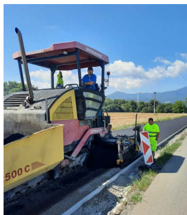
Finišeri kladli prvú asfaltovú vrstvu 20. augusta

Tak cyklisti ako aj chodci začali cyklotrasu a chodník popri Ul. M. Thomku-Mitrovského (štátna cesta III/2146 z Martina do Tomčian) využívať okamžite, ako sa z nej stiahli stavebné stroje a robotníci z oravskej firmy Dopstav. A v piatok 18. septembra sa zapísal do histórie Tomčian i cyklotrasa a prvého chodníka do rozvíjajúcej sa mestskej časti Tomčany. Tie sú súčasťou Martina od roku 1949, no na chodník čakali 70 rokov. Dielo stálo 367 000 eur a nezaobšlo sa ani na pás vodiacej a pás varovnej dlažby pre nevidiacich, ani na bezpečné premostenie potoka Siľava. Trasa bude v budúcnosti napojená na jestvujúcu sieť cyklotrás spájajúcu centrum s mestskými časťami.