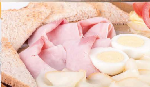
Šunkovo - syrový tanier s vajčkom a toastom