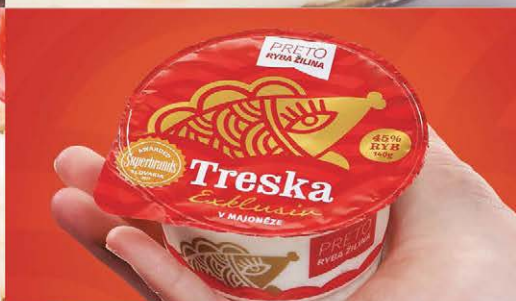
Treska & Rybí šalát