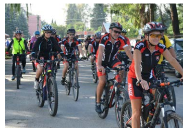
Účastníci 42. ročníka zrazu cyklistov