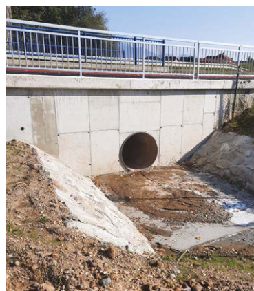
Premostenie Siľavy je bezpečné a veľkorysé