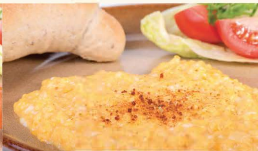
Pražnica na cibulke zo 4 vajec