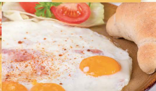
Hemendex zo 4 vajec