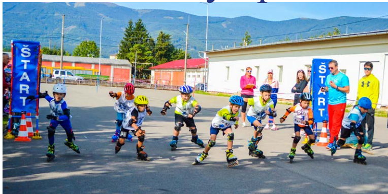
Štart bol dôležitý aj v kategórii najmladší žiaci.

I napriek pretrvávajúcim obmedzeniam súvisiacich s pandémiou koronavírusu, milovníci aktívneho pohybu a populárnej masovej športovej súťaže organizovanej MsÚ v Martine, pokračovali v naplňovaní bohatého celoročného programu Martinskej olympiády.