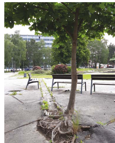
Symbol sily prírody - možno aj inšpirácia pre tých, ktorí chcú dať Vajanského námestiu tvár hodnú mena a poslania

Už v roku 2008 sa uskutočnila verejná architektonická súťaž na rekonštrukciu Vajanského námestia. Odtedy došlo k zmenám – k pôvodne jednému podlažiu podzemných garáží pribudlo ďalšie podlažie a v časti bývalej Neografie sa začalo pripravovať klientske centrum štátnej správy v Martine. V roku 2018 bola spracovaná dokumentácia pre územné rozhodnutie. V súčasnosti mesto rokuje s majiteľmi pozemkov. Náklady na celú investičnú akciu sa dnes odhadujú na 9 mil. eur a momentálne sa preverujú prípadné mimorozpočtové zdroje, pretože inak sa stavba posúva mimo súčasných možností mesta.