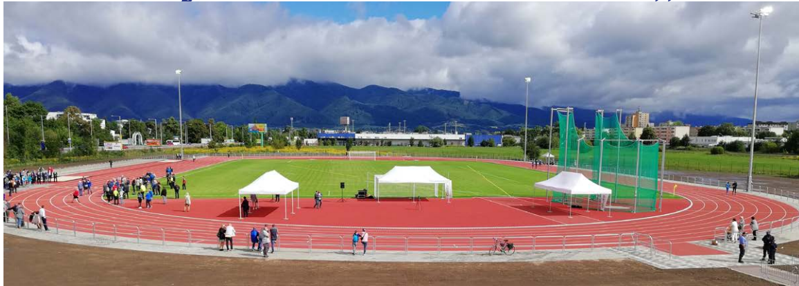
Novučká atletická dráha počas slávnostného otvorenia

Trvalo to síce dlho, kým v Martine vznikol moderný atletický areál, ale napokon uzrel svetlo sveta. Kvalitný 400-metrový osemdráhový tartanový ovál so všetkými sekciami pre technické disciplíny má certifikát Svetovej atletiky (WA).