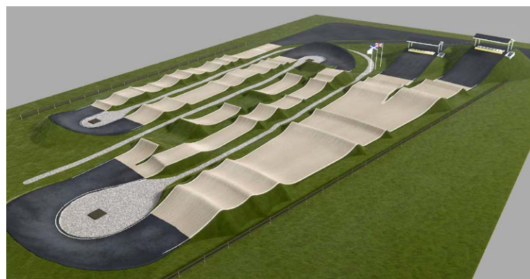
Štart výstavby špičkového bikrosového areálu v SIM-e mešká.

učesať zmluvu s mestom Martin o prenájme pozemkov (upraviť v nej nejaké detaily), na ktorých bude stáť športovisko. Verím, že napokon všetko dobre dopadne, začne sa stavať a aj sa to dokončí. Predpokladaná doba realizácie je minimálne poldruha roka. Areál bude mať širšie využitie, bude slúžiť verejnosti i pretekárom. Dúfam, že aj vďaka lepším podmienkam sa naši bikrosári budú zlepšovať. Druhý štartovací pahorok (vysoký 9 metrov) bude olympijský pre kategórie Elite (muži a ženy), prvý bude pre ostatné kategórie od 5 rokov (vysoký 6 metrov). Radi by sme tu v Martine v rámci spolupráce so SZC zriadili Centrum talentovanej