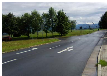
Ul. N. Hejnej s namietaným dopravným značením

Od križovatky ul. N. Hejnej - Stavbárska sa dá pokračovať dvoma pruhmi. Sú vyznačené prerušovanou čiarou. Na fotografii v prílohe vidno časť priechodu pre chodcov. V ľavom pruhu je šípka pre odbočenie vľavo. Vľavo je Tesco. V pravom je dvojšípka pre priamy smer a odbočenie vpravo. Priamym smerom pokračuje cesta do obytnej zóny. Ale čo ten smer vpravo. Tam