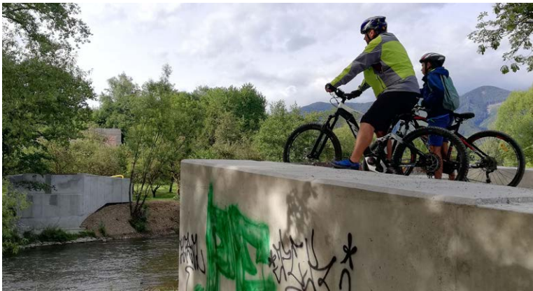
Tu bude premostenie cyklotrasy z jedného brehu rieky Turiec na druhý

Výstavba novej cyklotrasy z lokality Pltníky do Vrútok napreduje. Na martinskej strane (2,79 km) vidieť, aký pokrok sa v ostatných mesiacoch urobil (dodávateľom je spoločnosť Doprastav), ale už sa začalo pracovať aj na vrútockom úseku (131 m), ktorý vybuduje spoločnosť Erpos.