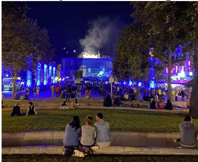
Mimoriadne priaznivý ohlas podujatia Duševný experiment priťahol ľudí i pozornosť

Nie náhodou k tomuto komentáru zaraďujeme fotografiu z podujatia Duševný experiment. Ono naznačilo, že v Martine drieme potenciál, ktorý sme nielenže ešte neodhalili, ale ktorý možno ani netušíme. Prečo je to tak, je ani nie polovica odpovede. Tá podstatná časť je: ako ho odhaliť, zaktivizovať a dostať do krvného obehu mesta. Nemusíme si nahovárať, že v Martine po oznámení tej úvodnej správy vybuchla búrka nadšenia, optimizmu a chuti do práce. Skepsa, maloverosť, vajatanie medzi absolútnymi prahmi (odmietnutie / nekritické snívanie) a spochybňovanie rôznych autorít či poverencov, to je prinajmenšom desaťročia stála súčasť mestského organizmu Martina. Napriek tomu pretrvali viaceré vynikajúce výsledky kultúrno-centrálneho vzopätia Martina z minulosti až do prítomnosti: napríklad Matica slovenská (hoci jej prítomnosť v meste cítiť primálo), Slovenská národná knižnica, Neografia, Slovenské komorné divadlo, Slovensná jar, Scénická žatva, Národný cintorín, Turč. galéria, z novších Fotoklub K. Plicku, divadelný festival Dotyky a spojenia, fungujú drobnéjšie a alternatívne scény atď. Z optimizmu po minulej kandida-