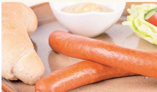
Domáce gazdovské párky