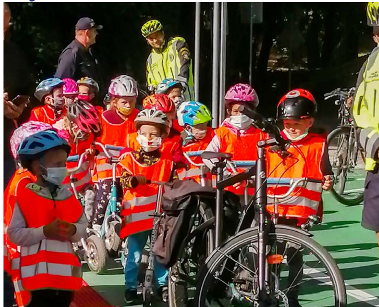
Prvými užívateľmi po oficiálnom otvorení boli deti z MŠ na Tajovského ul.

Tak cyklisti ako aj chodci začali cyklotrasu a chodník popri Ul. M. Thomku-Mitrovského (štátna cesta III/2146 z Martina do Tomčian) využívať okamžite, ako sa z nej stiahli stavebné stroje a robotníci z oravskej firmy Dopstav. A v piatok 18. septembra sa zapísal do histórie Tomčian i cyklotrasa a prvého chodníka do rozvíjajúcej sa mestskej časti Tomčany. Tie sú súčasťou Martina od roku 1949, no na chodník čakali 70 rokov. Dielo stálo 367 000 eur a nezaobšlo sa ani na pás vodiacej a pás varovnej dlažby pre nevidiacich, ani na bezpečné premostenie potoka Siľava. Trasa bude v budúcnosti napojená na jestvujúcu sieť cyklotrás spájajúcu centrum s mestskými časťami.