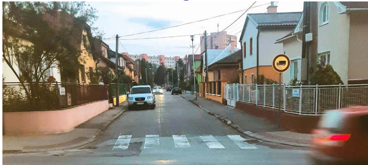
Rastislavova ulica - „vzorka“ problémov a starostí obyvateľov Starej Ľadovne: úzka ulica, autá, cintorín len so symbolickými parkoviskami a Sklabinská ul. bez priechodov pre chodcov.

Stará Ľadoveň – martinská štvrť okolo 150 domov, až na pár bytoviek sú to všetko rodinné domy. Posledné boli postavené koncom 60. rokov minulého storočia. Vtedy tichá štvrť na skok od centra. Dnes je to inak. Medzi obyvateľmi koloval obežník so súpisom problémov a námetmi na riešenie. Nespokojnosť rastie.