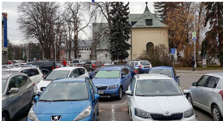
Námestie ako parkovisko sa prežilo; treba ho vrátiť "pešiakom", životu a k tomu, čo dalo mestu meno