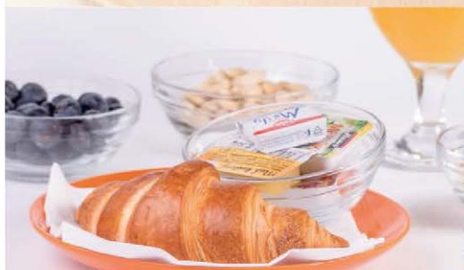
Čerstvý croissant, džem, med, masielko a džús