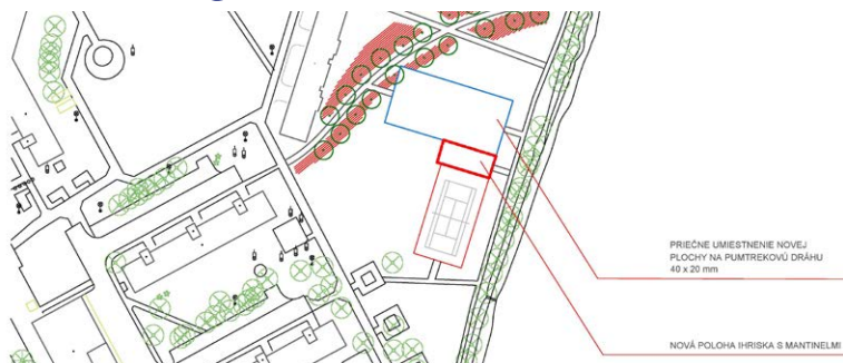
Zakreslené nové hokejbalové ihrisko a pumptracková dráha na Ladovni.

VMČ Ladoveň-Jahodníky-Tomčany vybral tri lokality na premiestnenie hokejbalového ihriska z Lermontovej ul. a ÚHA mesta Martin vybral najvhodnejšie miesto.