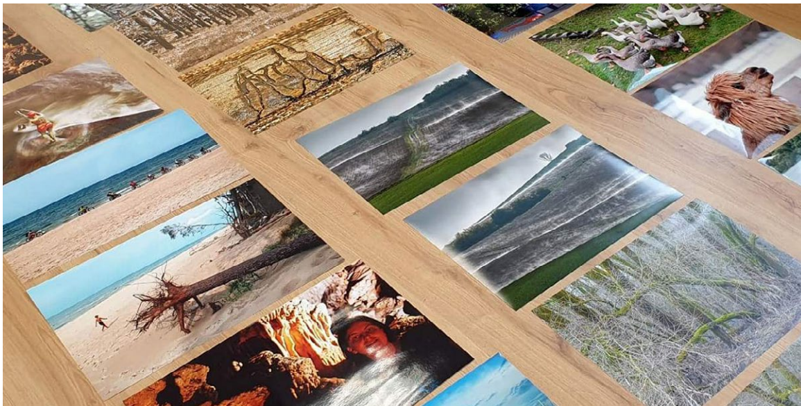
Ilustračná snímka z práce odbornej poroty regionálneho kola AMFO 2020 v Martine

Turčianske kultúrne stredisko v Martine získalo na základe konkurzu Národného osvetového centra poverenie organizovať celoštátne kolo súťaže AMFO v rokoch 2021-2024. AMFO je celoštátna postupová súťaž a výstava amatérskej fotografickej tvorby, jediná svojho druhu na Slovensku. Uskutočňuje sa každoročne, keď v priebehu roka postupne prebiehajú regionálne a krajské kolá naprieč Slovenskom a súťaž v novembri vrcholí celoštátnym kolom.