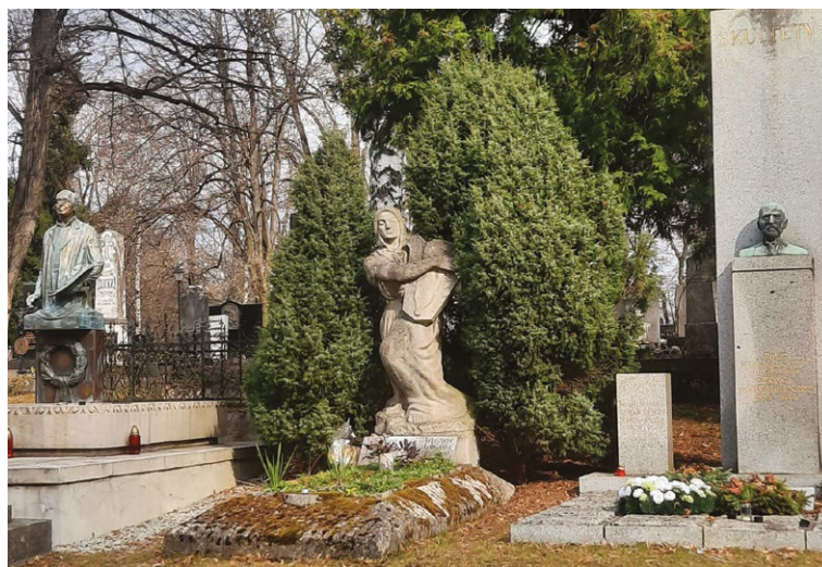
Národný cintorín - tri pomníky osobností dvoch storočí - Martin Benka, Vladimír Roy a Jozef Škultéty.

- Vnímam to v širších celonárodných súvislostiach. Už som niekde napísal, že slovenská kultúrna politika je dlhodobo neefektívna a chýbajú merateľné ukazovatele jej dosahu. Štvrtina národných kultúrnych pamiatok je v dezolátnom a narušenom stave, obnova si podľa revízie bude vyžadovať sumu medzi 1,8 až 5,5 miliardy eur. Zdá