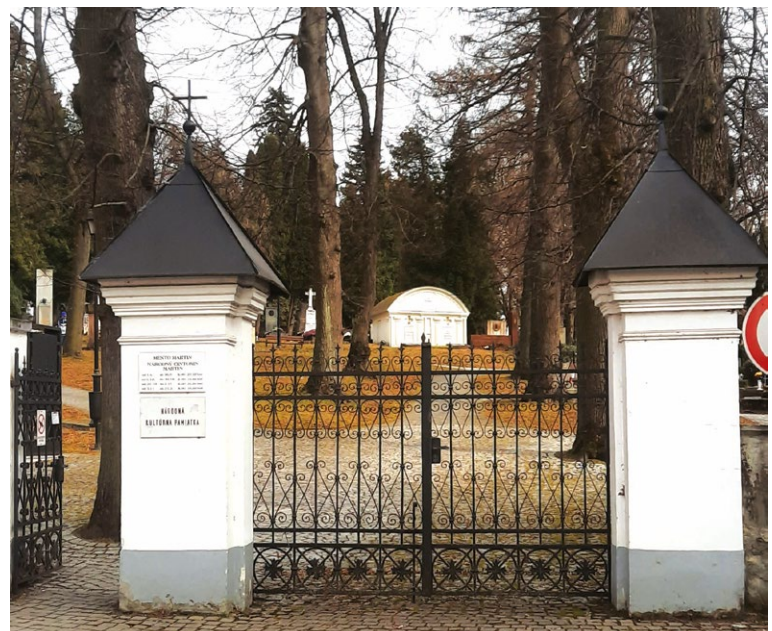
Národný cintorín je len jeden na Slovensku. V Martine!