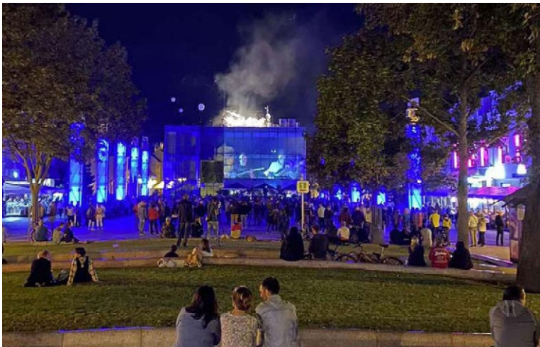
Vlani v septembri vzbudil záujem verejnosti koncert kapely Duševný experiment na streche budovy Millénia v centre mesta.

Ako už viete, jedenásťčlenná medzinárodná hodnotiacia komisia svojím verdiktom rozhodla, že do užšieho výberu z ôsmich kandidujúcich slovenských miest o titul Európske hlavné mesto kultúry 2026 (EHMK) postúpili tri – Trenčín, Nitra, Žilina. Martin teda vo svojej kandidatúre neuspel.