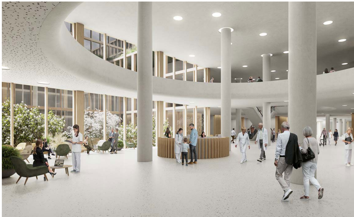
Vizualizácia vstupného átria novej Nemocnice budúcnosti Martin na Malej hore

Historickej investícii, ktorá nielen posunie medicínsko-zdravotnícky komplex zariadení v Martine na novú úroveň, ale aj zosilní vedecko-výskumný pilier Martina a jeho charakter moderného mesta, pandémie nesvedčí. Skorý prvý výkop na Malej hore sa zas oddaľuje – no napriek tomu príprava pokračuje a nádej má stále reálne kontúry.