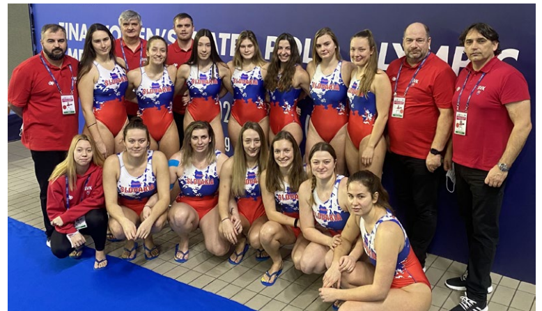
Slovenská reprezentácia vo vodnom póle na turnaji v Terste.

„Na Martine mám najradšej hory. Je super; že je tu na skok do prírody. Okrem toho tu žije celá moja rodina, takže aj keď momentálne väčšiu časť času pôsobím v Česku, na domov sa vždy veľmi teším.“